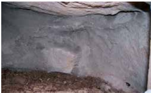
III. 8 : Intérieur bétonné. Important: l'eau doit pouvoir s'écouler sans inonder la niche.

Point 4. Construire deux cadres en bois selon le modèle (point 2) et en coller un dans l'ouverture de la cavité – à une profondeur d'environ 8 cm permettant de placer la pierre de couverture (III. 7 et 9).