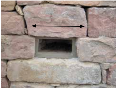
III. 7: Le « toit » (flèche noire) doit dépasser la niche des deux côtés. (Point 4 déjà effectué sur cette photo).

Insérer une niche dans un mur a posteriori nécessite l'avis et la collaboration d'un(e) expert(e) des murs – normalement la personne ayant construit le mur en question. Cherchez un endroit peu dérangé (la huppe est sensible) et une pierre qui tient un peu moins fortement que les autres. Tous les murs n'abritent pas forcément une pierre amovible. Dans certains cas, une pierre doit être cassée pour être enlevée ou vous êtes obligé de démonter le haut du mur, de placer une pierre en tant que « toit » et de reconstruire le mur.