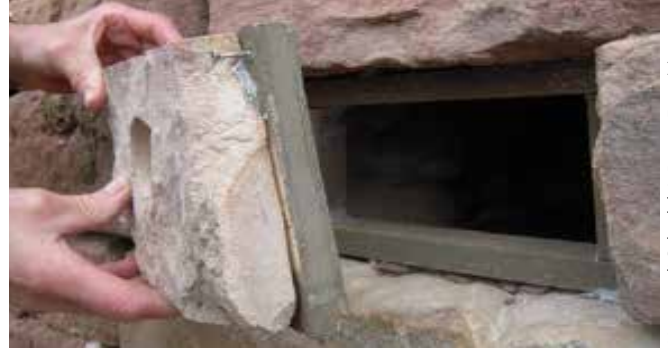
III. 9: Les angles de la pierre de couverture sont coupés pour pouvoir placer les vis.

Point 5. « Tailler » la pierre de couverture (voir liste de matériel) à l'aide d'un burin et arrondir les angles pour pouvoir placer les vis (III. 9). Percer le trou d'envol d'un diamètre de 6 cm à l'aide d'un foret diamant. Le trou d'envol n'est pas placé en plein milieu mais vers un côté à 5 cm au moins de l'angle supérieur (III. 10).