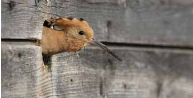
III. 4: Une huppe fasciée guignee à l'extérieur d'un nichoir en bois.

La huppe profite de mesures prises pour d'autres espèces comme l'aménagement de prairies fleuries extensives, de haies, de bosquets, de petites structures, etc. Les mesures de conservation spécifiques sont plus difficiles à formuler et concernent surtout une meilleure accessibilité de la nourriture et l'offre en sites de nidification. Une fauche alternée ou la création de surfaces à végétation rase rendent ainsi les proies plus accessibles. En Valais, la Station ornithologique suisse et l'Université de Berne ont réussi à favoriser la huppe avec l'installation de nichoirs.