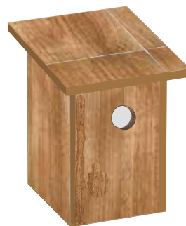
III. 6: Nichoir fixé verticalement. Paroi arrière (37 x 26 cm), parois latérales avec biais (37-33 x 26 cm), paroi avant (26 x 33 cm), trou (6 cm), plancher (28 x 28 cm), toit (34 x 34 cm). Ces mesures sont indicatives et peuvent être adaptées selon la situation.

Nous recommandons de ne fixer le toit ou la paroi arrière qu'à peu d'endroits afin de pouvoir ouvrir facilement le nichoir pour le nettoyage. Le trou d'envol est percé dans un des coins supérieurs. Les nichoirs sont installés horizontalement pour que les jeunes soient protégés des intempéries et aient plus de place (les huppés pondent jusqu'à 10 œufs). Le fond du nichoir est recouvert de sciure ou de bois décomposé. Si aucune maisonnette ou structure similaire n'est disponible, les nichoirs peuvent aussi être fixés aux arbres. Les nichoirs extérieurs doivent avoir un toit en pente pour permettre à la pluie de s'écouler.