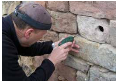
III. 10 : Le trou d'envol est placé dans un des coins supérieurs afin que les jeunes soient protégés du mauvais temps.

Point 6. Coller la pierre de couverture sur le cadre en bois.