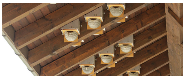
Adéquat – Nids artificiels fixés sur des chevrons et éloignés de la paroi.