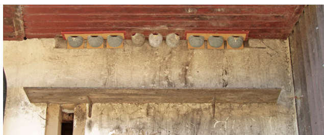
Adéquat – Planchette à fientes sous les nids artificiels.

La deuxième ou troisième nichée est en route.