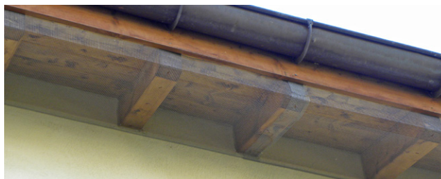
Adéquat – Grillage protégeant la façade aux endroits sensibles.